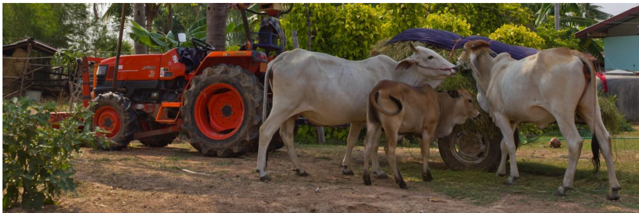
Mayor volumen de registro en la BMC fue Ganado en pie.