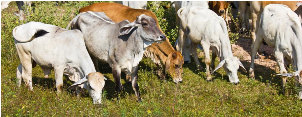
Mayor volumen de registro en la BMC fue Ganado en pie.