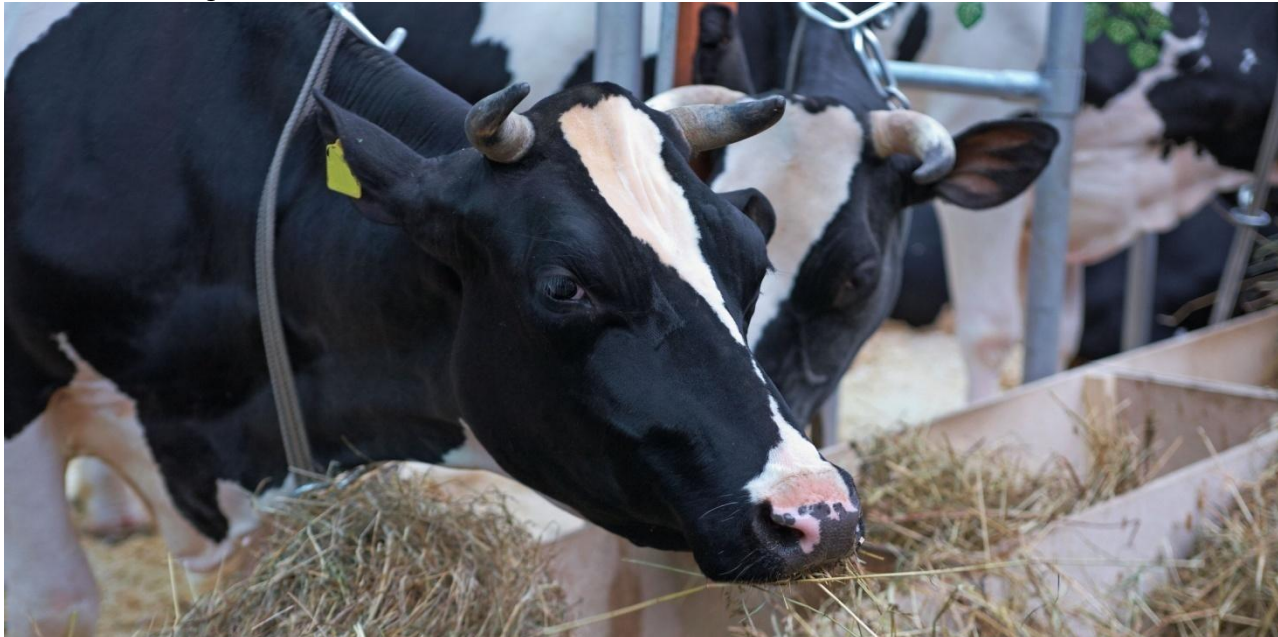
Mayor volumen de registro en la BMC fue Ganado en pie.