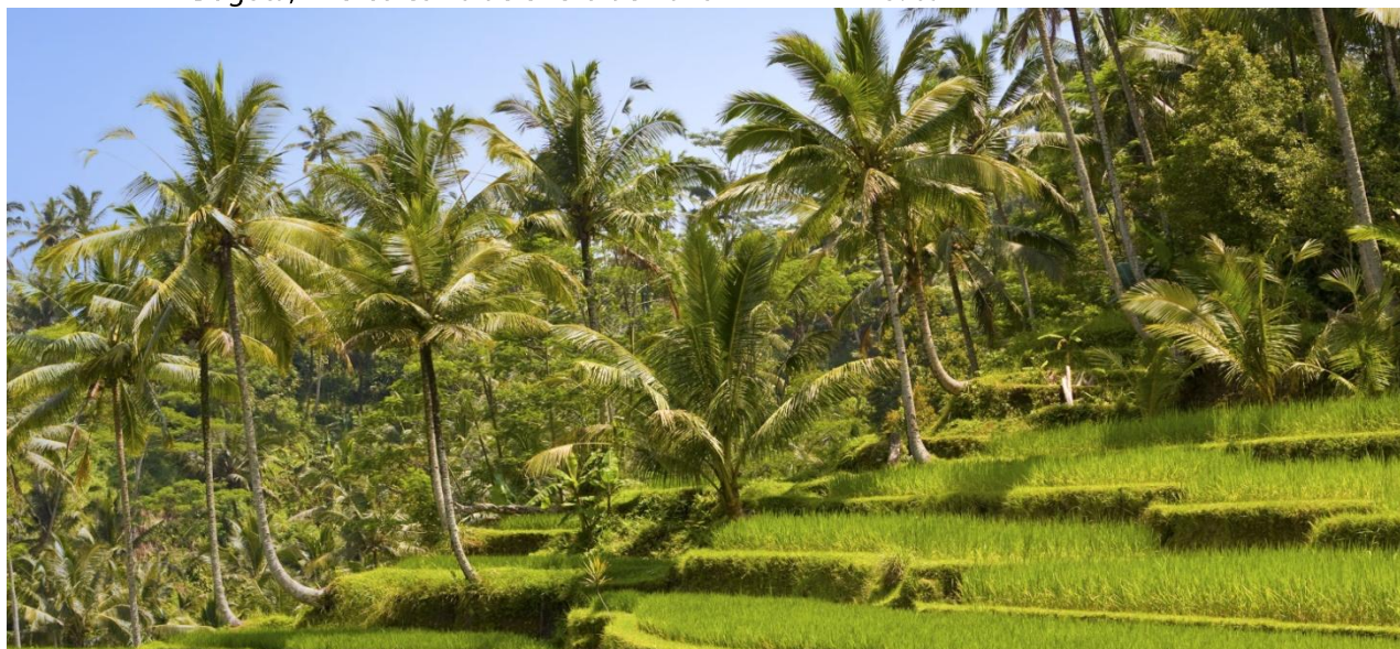
El mayor volumen de registro en en la Bolsa Mercantil de Colombia fue de Aceite crudo de palma.