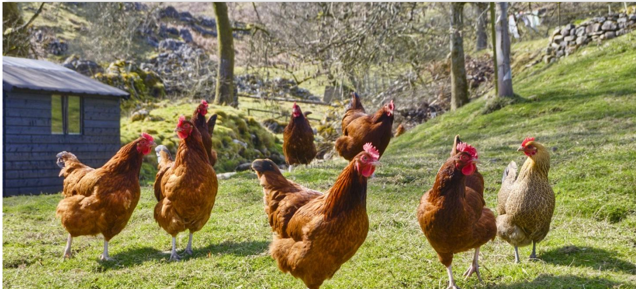
El mayor volumen de registro en la Bolsa Mercantil de Colombia fue de Alimento concentrado para aves.