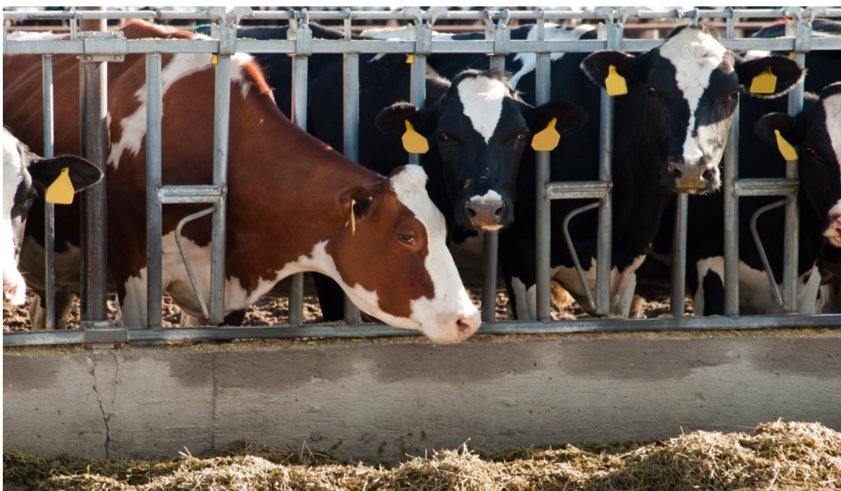
El mayor volumen de registro en la Bolsa Mercantil de Colombia fue de Ganado en pie.