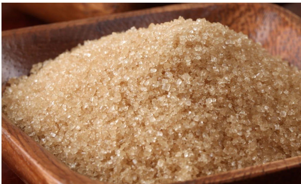
El mayor volumen de registro en la Bolsa Mercantil de Colombia fue de Azúcar blanco.