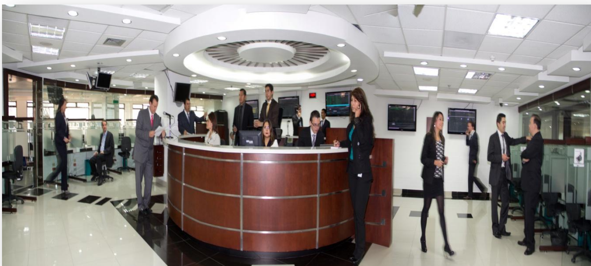
Rueda de Negocios Bolsa Mercantil de Colombia