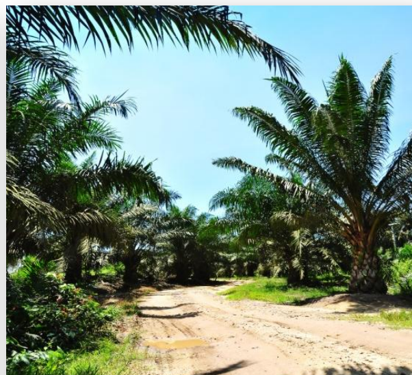
Uno de los productos más registrados en la Bolsa Mercantil de Colombia fue Aceite crudo de palma.