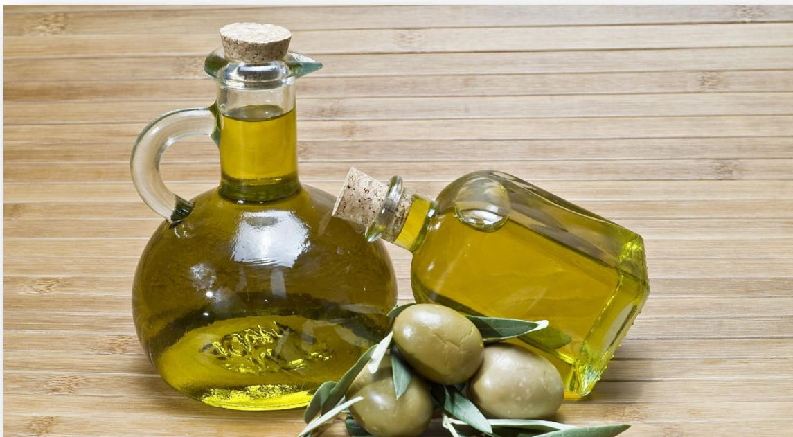
El mayor volumen de registro en la Bolsa Mercantil de Colombia fue de Aceite