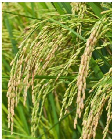
Tasa promedio de arroz cáscara 7.60%

El índice de la tasa de las operaciones financieras de la Bolsa se mantuvo estable.