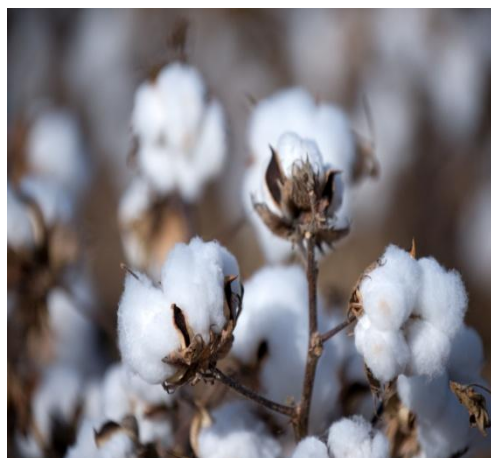
Tasa promedio de Fibra de algodón 9.00%

El índice de la tasa de las operaciones financieras de la Bolsa subió 33 puntos básicos, debido a operaciones de CDM de Aguardiente.