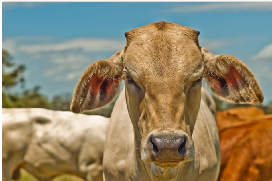
El mayor volumen de registro en la Bolsa Mercantil de Colombia fue de Ganado en pie.