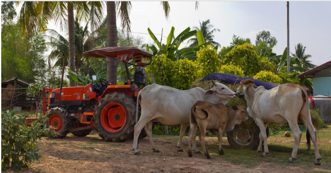
El mayor volumen de registro en la Bolsa Mercantil de Colombia fue de Ganado en pie.