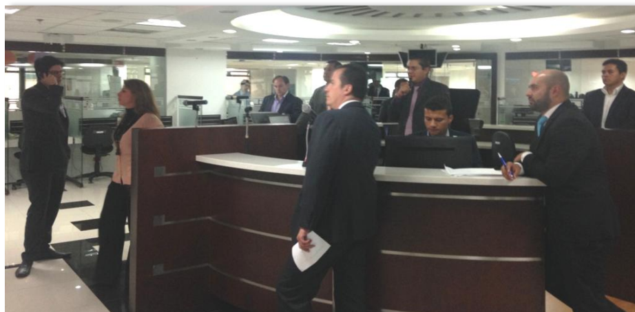
Rueda de Negocios, Mercado de Compras Públicas, Bolsa Mercantil de Colombia.