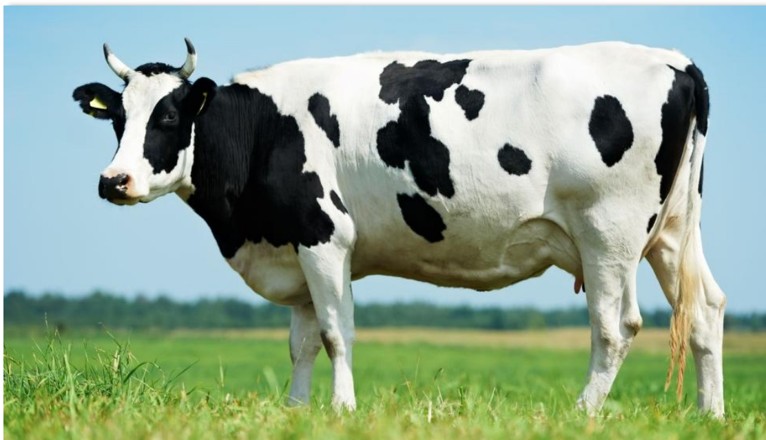
El mayor volumen de registro en la Bolsa Mercantil de Colombia fue de Ganado en pie.