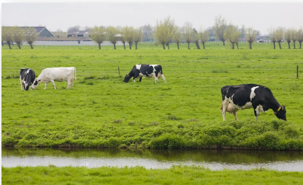
El mayor volumen de registro en la Bolsa Mercantil de Colombia fue de Ganado en pie.