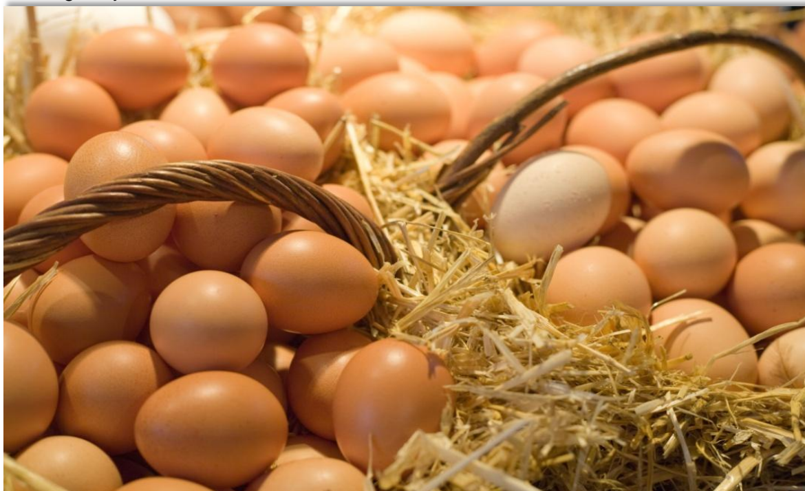
El mayor volumen de registro en la Bolsa Mercantil de Colombia fue de Huevo fresco de gallina rojo.