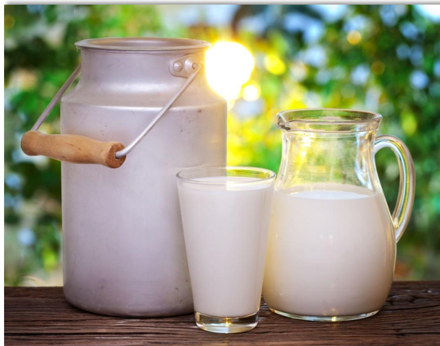
El mayor volumen de registro en la Bolsa Mercantil de Colombia fue de Leche