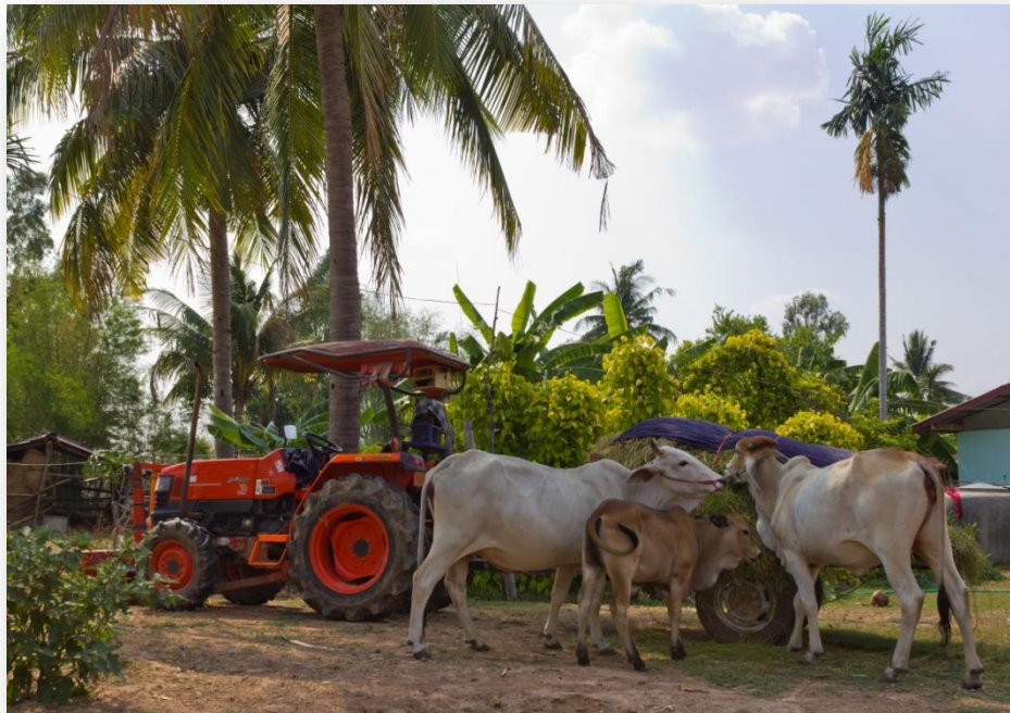
El mayor volumen de registro en la Bolsa Mercantil de Colombia fue de ganado.