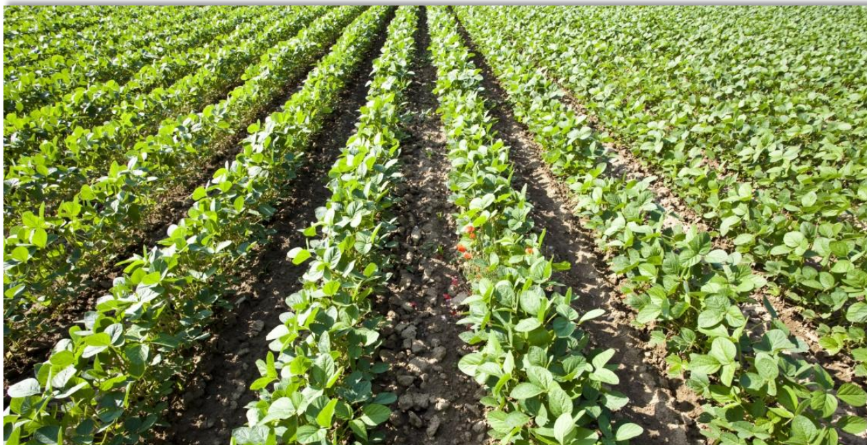
El mayor volumen de registro en la Bolsa Mercantil fue de aceite crudo de soya