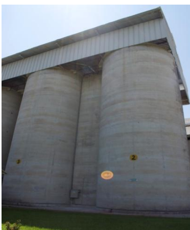
SILOS DE ARROZ

El índice de la tasa de las operaciones financieras de la Bolsa creció en 5 puntos básicos.