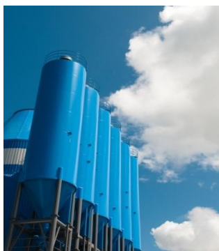
Silos de arroz

El índice de la tasa de las operaciones financieras de la Bolsa disminuyó en 5 puntos básicos en comparación al miércoles 20 de abril, que se encontraba en 10.05%