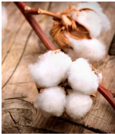
Fibra de algodón

El índice de la tasa de las operaciones financieras de la Bolsa Mercantil de Colombia disminuyó en 13 puntos básicos, teniendo una variación negativa de 2.72% en comparación al lunes 25 de abril, cuando se encontraba en el 10.18%.