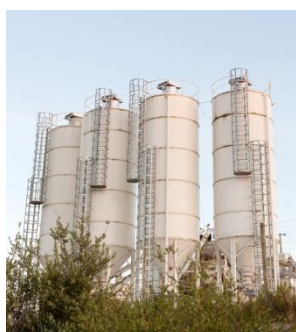
Silos de almacenamiento

El índice de la tasa de las operaciones financieras de la Bolsa Mercantil de Colombia aumentó en 2 puntos básicos en comparación al día martes 3 de mayo, cuando se encontraba en 10.13%