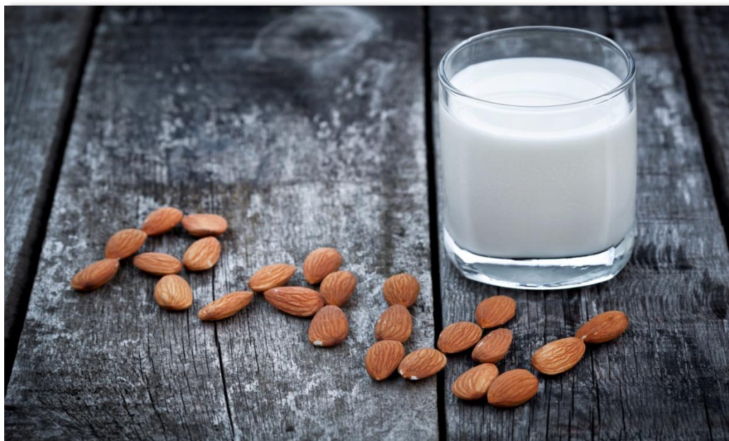
El mayor volumen de Registro de Facturas en la Bolsa Mercantil de Colombia fue de leche cruda.