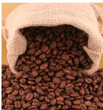
Tasa promedio semanal de café excelso es 10.20%

El índice de la tasa de las operaciones financieras de la Bolsa Mercantil de Colombia aumento en 5 puntos básicos en comparación al lunes 16 cuando el índice iRent estaba en 10.15%.