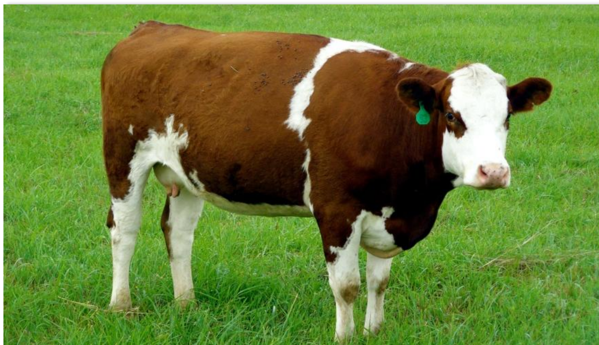
El mayor volumen de Registro de Facturas en la Bolsa Mercantil de Colombia fue de ganado.