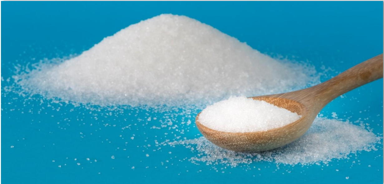
El mayor volumen de Registro de Facturas en la Bolsa Mercantil de Colombia fue de azúcar blanca.