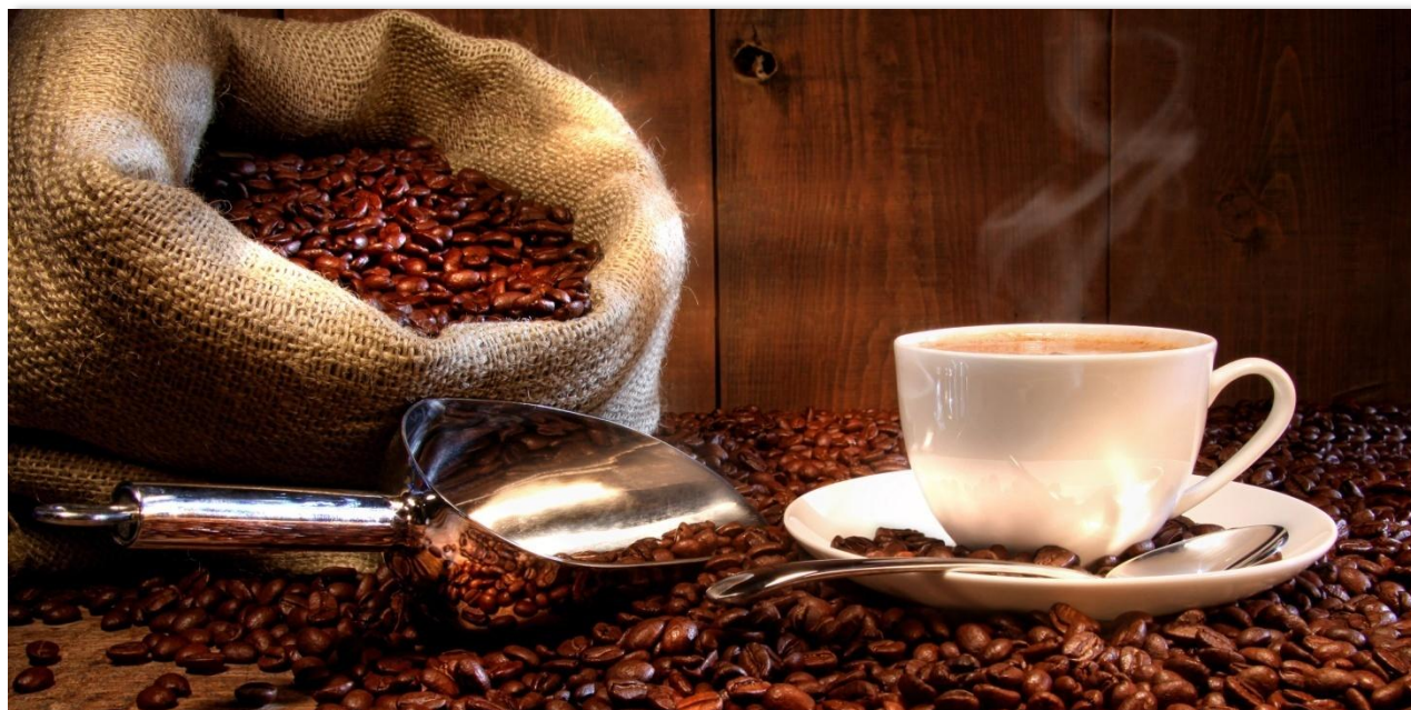
El mayor volumen de Registro de Facturas en la Bolsa Mercantil de Colombia fue de café excelso.