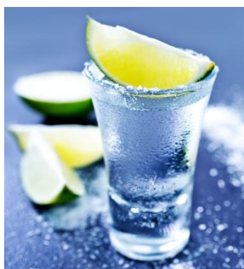
La tasa promedio semanal del Aguardiente es de 10.20%

El índice de la tasa de las operaciones financieras de la Bolsa Mercantil de Colombia se comportó estable con una tasa iRent de 10.20%.