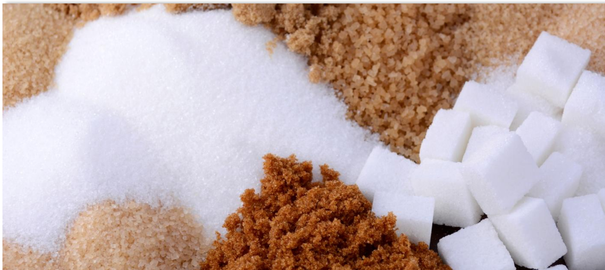
El mayor volumen de Registro de Facturas en la Bolsa Mercantil de Colombia fue de azúcar blanca.