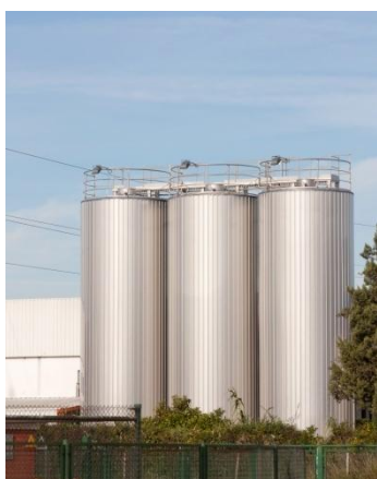
Silos de Arroz

El índice de la tasa de las operaciones financieras de la Bolsa Mercantil de Colombia se comportó estable con una tasa iRent de 10.20%.