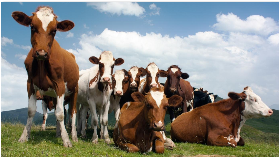
El mayor volumen de Registro de Facturas en la Bolsa Mercantil de Colombia fue de ganado.