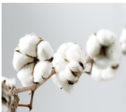
Fibra de Algodón

El índice de la tasa de las operaciones financieras de la Bolsa Mercantil de Colombia disminuyó en 7 punto básico; ahora registra una tasa iRent de 10.12%.