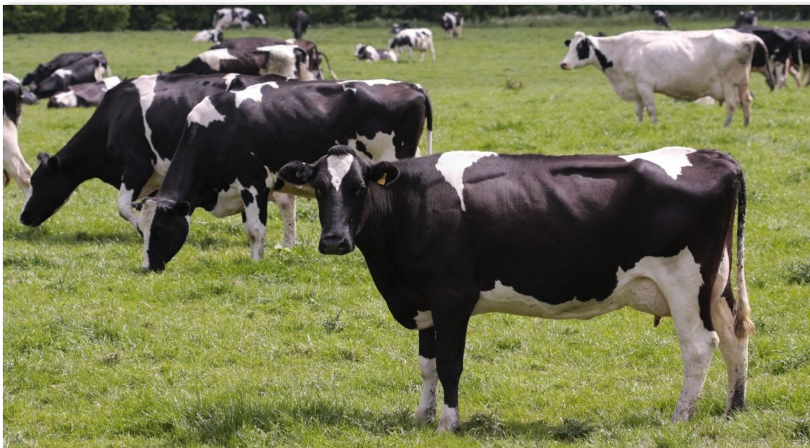
El mayor volumen de Registro de Facturas en la Bolsa Mercantil de Colombia fue de carne de vacuno en canal.