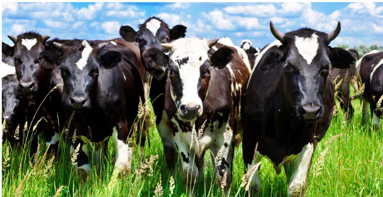
El mayor volumen de Registro de Facturas en la Bolsa Mercantil de Colombia fue de ganado.