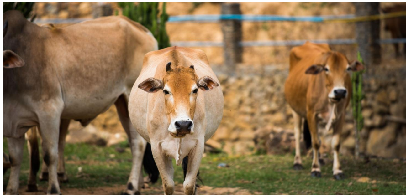
El mayor volumen de Registro de Facturas en la Bolsa Mercantil de Colombia fue de ganado.