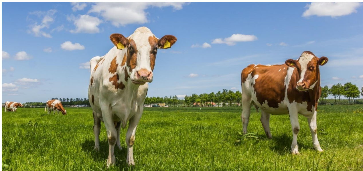
El mayor volumen de transacciones ingresadas al sistema de registro de la BMC fue de ganado