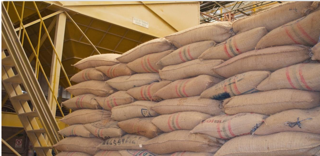
El mayor volumen de transacciones ingresadas al sistema de registro de la Bolsa, fue de arroz blanco nacional en saco.