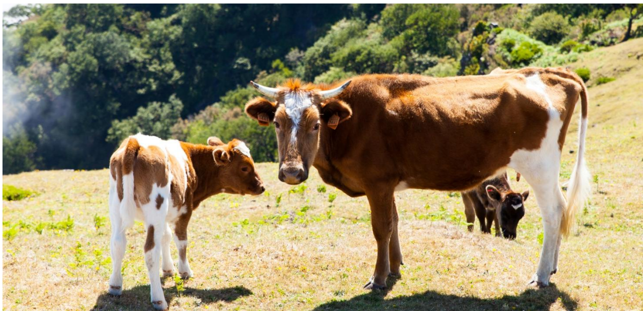
El mayor volumen de transacciones ingresadas al sistema de registro de la BMC fue de novillo.