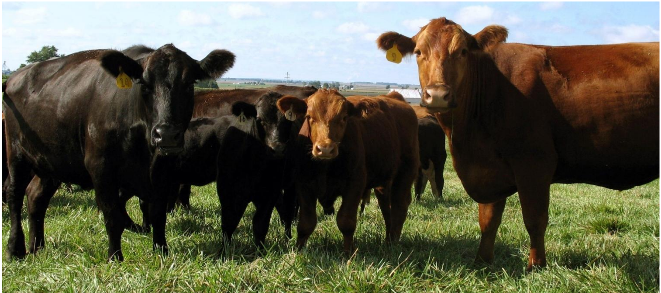
El mayor volumen de transacciones ingresadas al sistema de registro de la Bolsa Mercantil de Colombia fue de ganado.