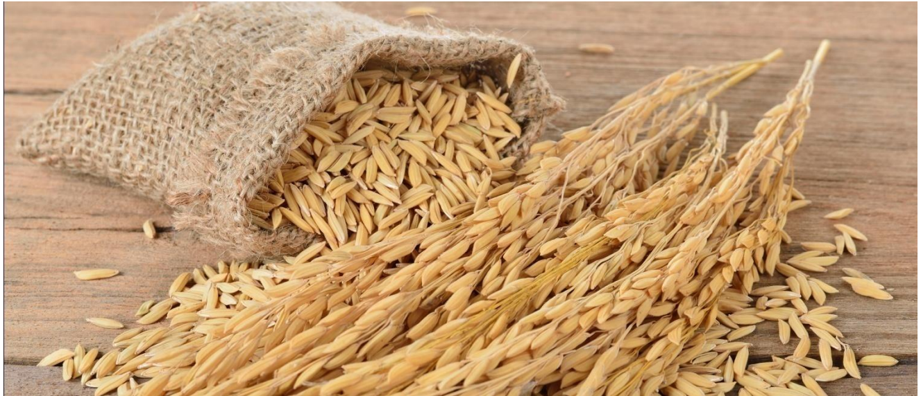
El mayor volumen de transacciones ingresadas al sistema de registro de la Bolsa Mercantil de Colombia fue de arroz cascara nacional.