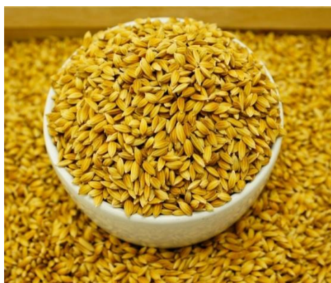
Foto: Arroz Cáscara

El índice de la tasa de operaciones financieras de la Bolsa Mercantil de Colombia, se comporto estable, registrando una tasa iRent de 10.31%