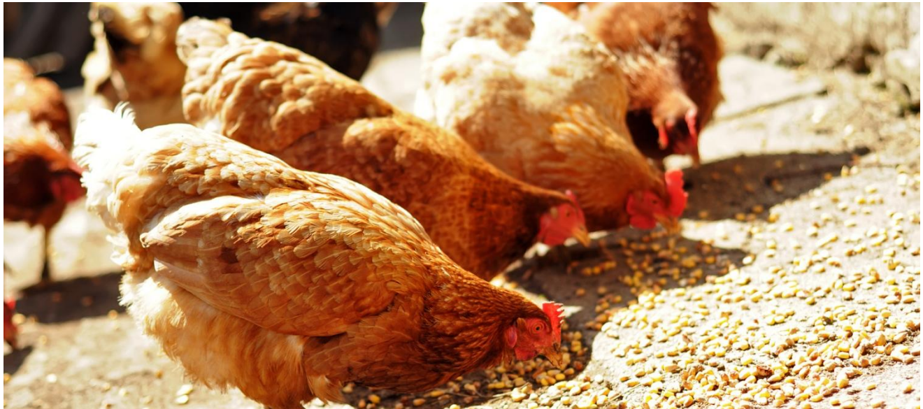
Alimento concentrado para aves tuvo un precio promedio de $ 1,258 por Kilogramo en el sistema de registro de la Bolsa Mercantil de Colombia