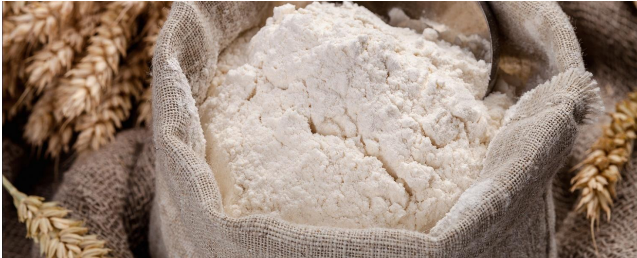
HARINA DE TRIGO DE PRIMERA EN SACO

Información del 19 de septiembre del 2016