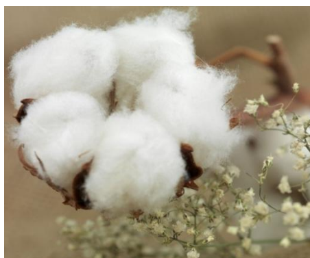
Fibra de Algodón

El índice de la tasa de operaciones financieras de la Bolsa Mercantil de Colombia S.A., se comportó estable, registrando una tasa iRent de 10.72%