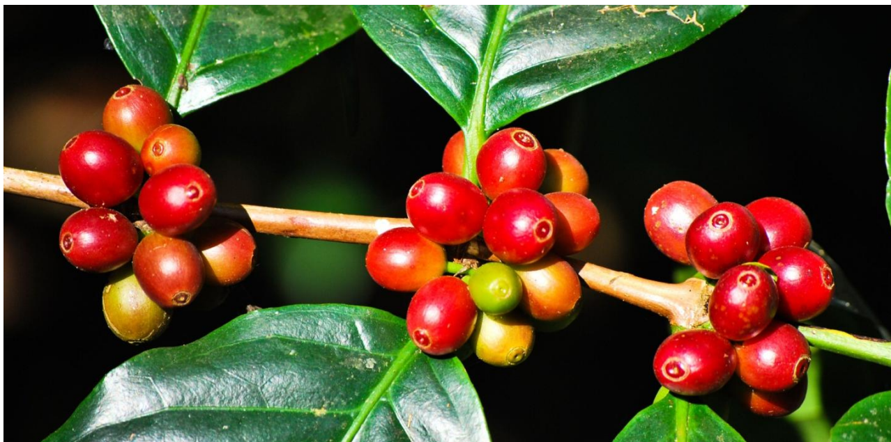
El café pergamino tuvo un precio promedio de $7,108 por kg en el sistema de registro de la Bolsa Mercantil de Colombia.