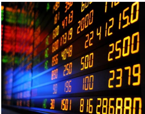
Índice de las Tasas Financieras de la Bolsa Mercantil de Colombia S.A.

El índice de la tasa de operaciones financieras de la Bolsa Mercantil de Colombia S.A., se comportó estable, registrando una tasa iRent de 12.86%.