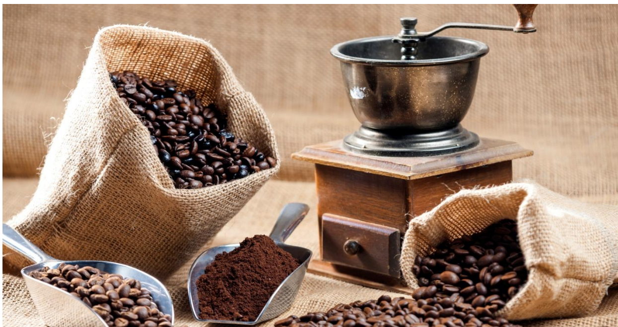
El café excelso tuvo un precio promedio de $ 9,550 por kg, en el sistema de registro de la Bolsa Mercantil de Colombia.