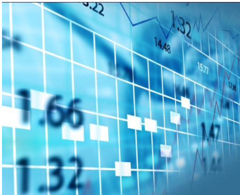
Índice de las Tasas Financieras de la Bolsa Mercantil de Colombia S.A.

El índice de la tasa de operaciones financieras de la Bolsa Mercantil de Colombia S.A., se comportó estable, registrando una tasa iRent de 12.00%.