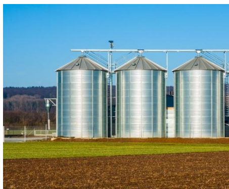
Índice de las Tasas Financieras de la Bolsa Mercantil de Colombia S.A.

El índice de la tasa de operaciones financieras de la Bolsa Mercantil de Colombia S.A., se comportó estable. Registró una tasa iRent de 12.00%.