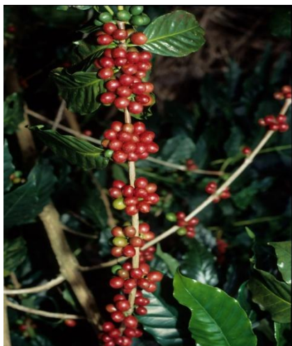
La tasa promedio semanal fue de Café excelso con 8.30%

El índice de la tasa de las operaciones financieras de la Bolsa se mantuvo estable.