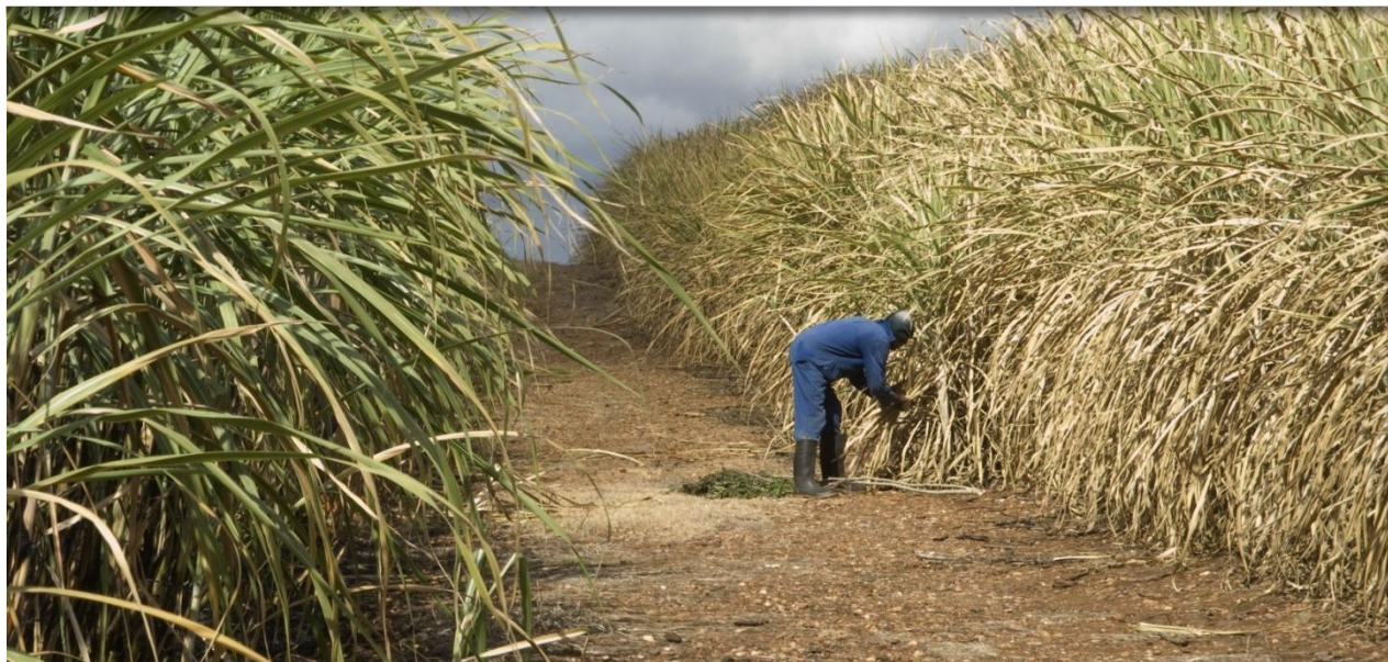
Uno de los productos más registrados en la Bolsa Mercantil de Colombia fue Azúcar Blanca y Azúcar Refinada. Foto, Cultivo de Caña